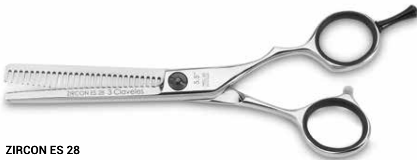
ZIRCON ES 28 98984 5,5"