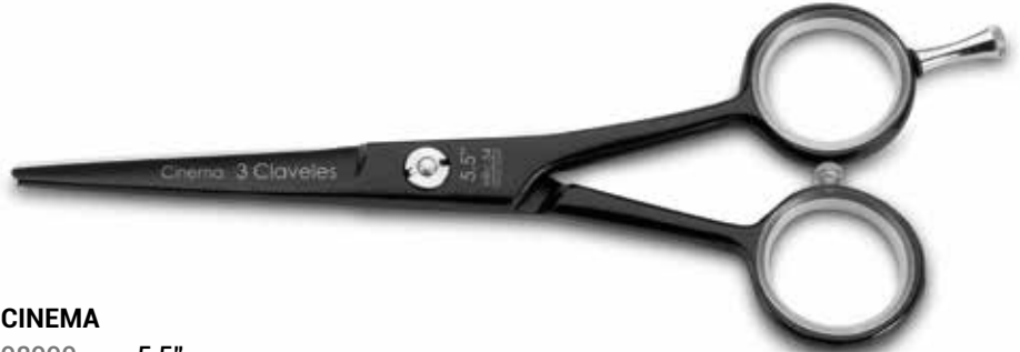
CINEMA 98990 5,5"

شفرة مقعرة فولاذ مقاوم للصدأ AISI 420-4034 درجة صلابة 54 HRc برغي مسطح قابل للتعديل