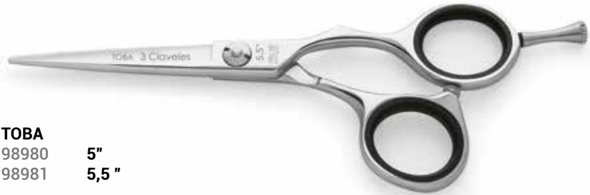
TOBA 98980 5" 98981 5,5"

شفرة مقعرة شفرة قاطعة 40° فولاذ مقاوم للصدأ AISI 440 C درجة صلابة HRc 60 برغي مسطح قابل للتعديل