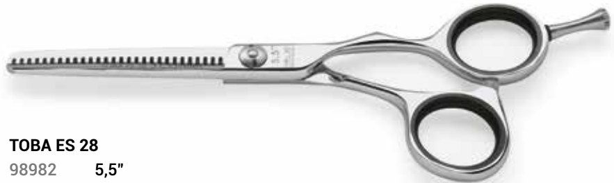
TOBA ES 28 98982 5,5"