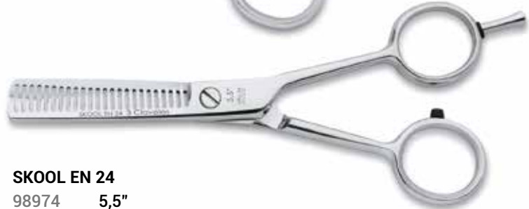
SKOOL EN 24 98974 5,5"

شفرة ناعمة 45° شفرة AISI 420-4034 فولاذ مقاوم للصدأ درجة صلابة HRc 54 برغي مسطح