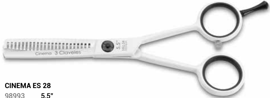
CINEMA ES 28 98993 5,5"