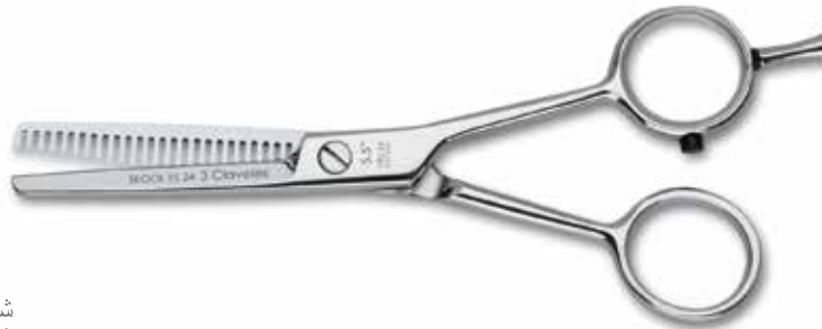
SKOOL ES 24 98975 5,5"