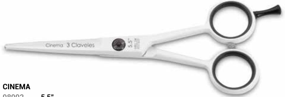
CINEMA 98992 5,5"

شفرة مقعرة AISI 420-4034 فولاذ مقاوم للصدأ. درجة صلابة HRc 54 برغي مسطح قابل للتعديل