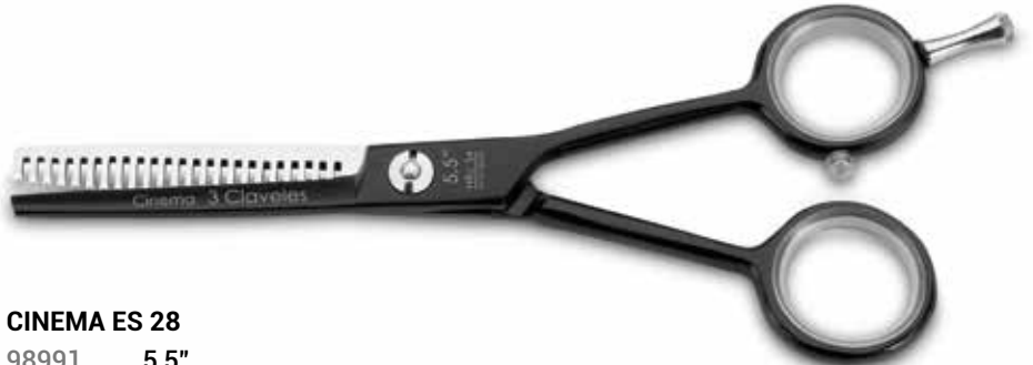
CINEMA ES 28 98991 5,5"