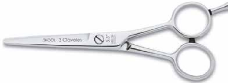
SKOOL 98973 5,5"