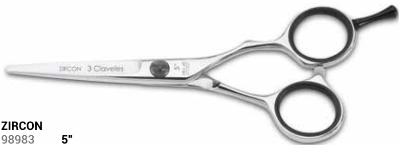
ZIRCON 98983 5"

شفرة مقعرة شفرة قاطعة 40° فولاذ مقاوم للصدأ AISI 440 C درجة صلابة HRc 60 برغي مسطح قابل للتعديل